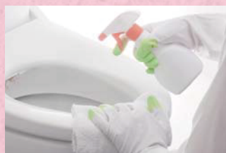
トイレの除菌・脱臭