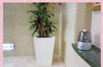
噴霧器での空間除菌